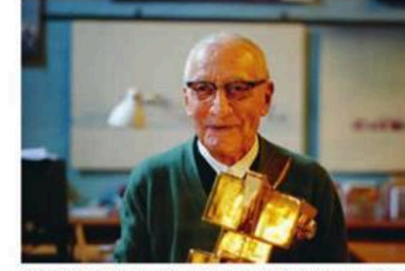
ALESSANDRO MENDINI, EDITÖR, KURUCU TASARIMCI, ATELIER MENDINI

Yaşadığımız dünya koşullarına göre trendler değişiyor ve şekilleniyor. Dünyanın gelgitleri sonucu yeniden doğaya dönüyor, low-tech çözümlere yöneliyoruz, malzeme ve form arayışındaki gereksinimlerimiz değişiyor. İnovasyonun, hikayenin, konseptin formu takip ettiği bir çağdan bahsedebilir miyiz? Formun meselesi size göre nasıl ve neye bağlı olarak değişiyor?